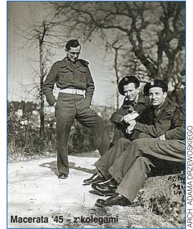
Macerata '45 – z kolegami

Z Polskiego Radia przenieśliem się do Polskich Nagrań, a jakiś czas potem z trzema kolegami zaproponowaliśmy w PAX'e założenie fabryki płyt gramofonowych. Piasecki to kupił. I tak pow-