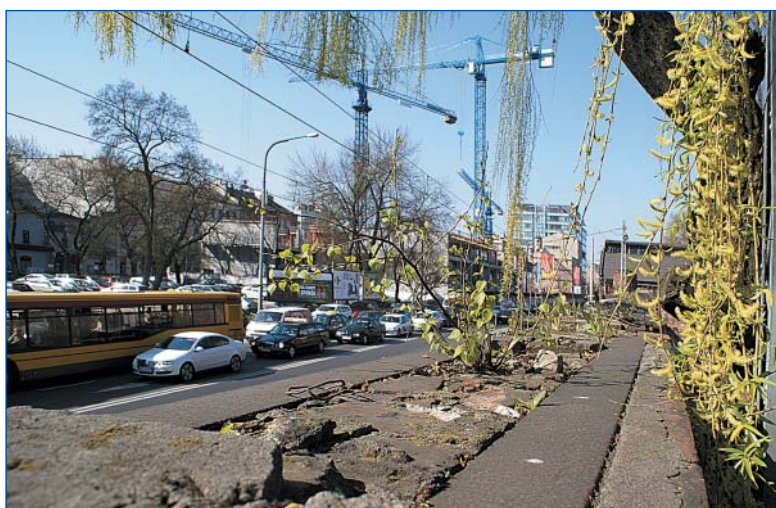
Rzut oka z Norblina na Prosta

W katalogach produktów zakładów Norblina z końca XIX w. istniało 5 tys. pozycji Przed II wojną światową zakłady Norblina zatrudniały 2230 pracowników