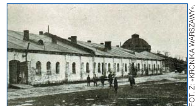
Jeden z magazynów, w głębi sylwetka elewatora.