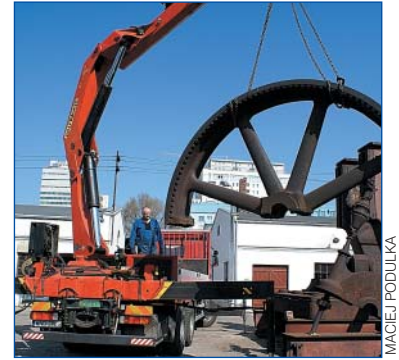
... i ładowana na ciężarówkę

Jako taką znajomością tematu mogła się pochwalić część mieszkańców Woli.