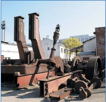
Maszyna parowa – jeszcze w Norblinie

Przez wiele lat stowarzyszenie mogło uwłaszczyć się na tym terenie i dalej prowadzić działalność muzealną i kulturalną w Norblinie. Mogło też w inny sposób uregulować sytuację prawną terenu. Jednak nie zrobiło tego i kiedy macierzysta fabryka Norblin SA na Młocinach upadła, syndyk masy upadłościowej przypomniał sobie o terenie przy Żelaznej 51/53. Wojewoda Mazowiecki przekazał zabytki syndykowi, a ten sprzedał wszystko spółce ALM DOM za 67,5 mln zł. Wszystko odbyło