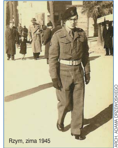
Rzym, zima 1945

— No tak, wiedzieliśmy, że coś się dzieje. Oni też się czegoś spodziewali, dlatego nie było pełnego zaskoczenia. W tym wszystkim było sporo improwizacji. Teraz po latach, gdy się to na trzeźwo analizuje, można się dziwić, że Powstanie w ogóle wybuchło i jeszcze się tak długo utrzymało. A utrzymało się dlatego, że nie chcieliśmy iść do obozów. Przynajmniej, póki było czym walczyć. Moim zdaniem sprawdziły się komórki niższego szczebla – bataliony i ich