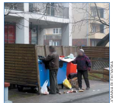
Ta prowizoryczna „altanka” nie daje szans na czyste podwórko (ul. Bema 81)