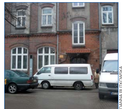
Kierowcy zastawiają nawet wejście do domu (Bema 81)